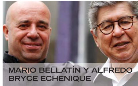
MARIO BELLATÍN Y ALFREDO BRYCE ECHENIQUE

“EN LA PROPUESTA DEL HAY FESTIVAL está la búsqueda de la comunión, del intercambio con los lectores, sin mayor formalismo: el festejo de la palabra.” Milenio